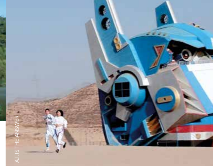
A.I. IS THE ANSWER