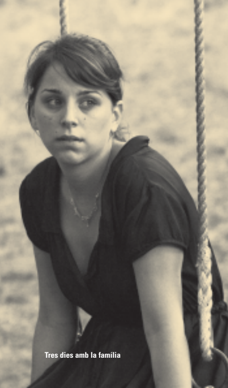
Tres dies amb la família